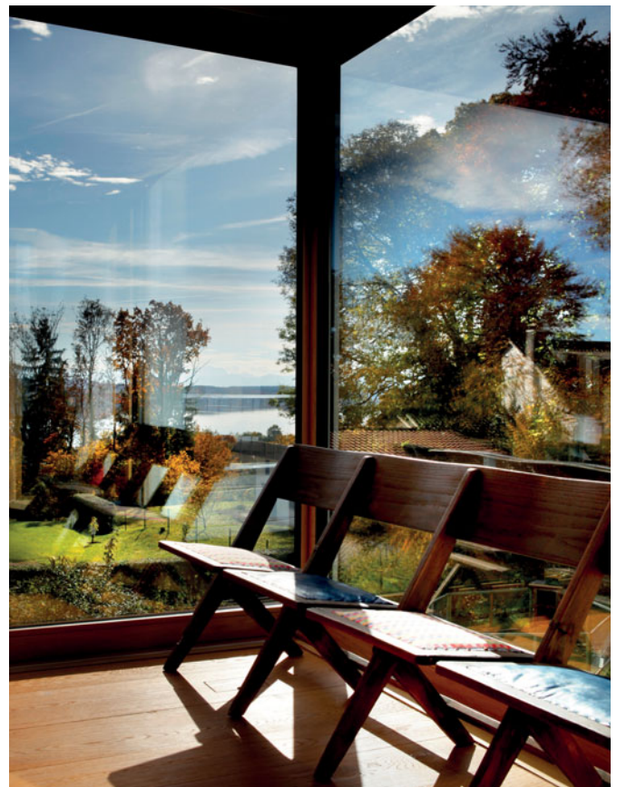
Der Blick auf den Wörthsee vom Kinderhaus aus

„Eltern-“ und „Kinderhaus“ geben jeder Generation einen eigenen Bereich. „Wir wollten ein offenes Haus, in dem immer alle willkommen sind und Platz finden, auch später, wenn unsere Kinder Partner und eigene Familien haben. Wir wollten eine Art wandelbares Generationenhaus, und