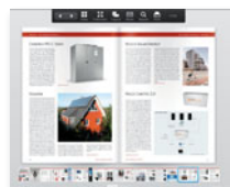
smart homes PRO Der kostenfreie Newsletter für den Gebäudeprofi

Folgen Sie uns auf Facebook: www.facebook.com/trenddokument • www.facebook.com/smarthomesmag